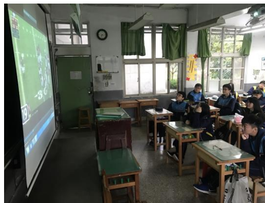
實戰影片觀賞並說明規則