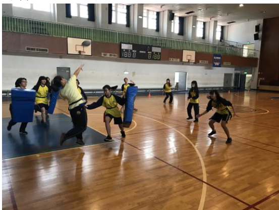
小組對抗實況 (女生)