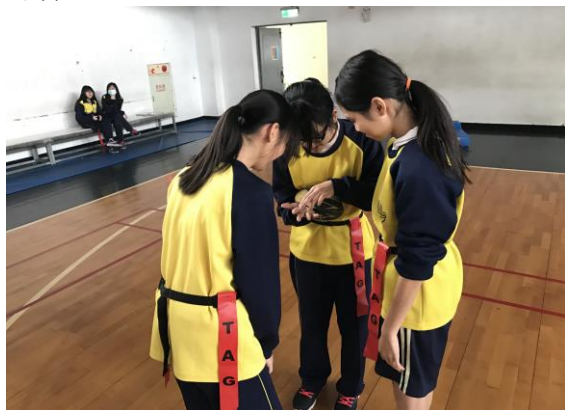
驗證實體空間操作之可行性