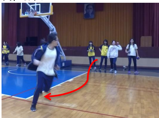
行進間傳接球搭配實作（跑的路線）