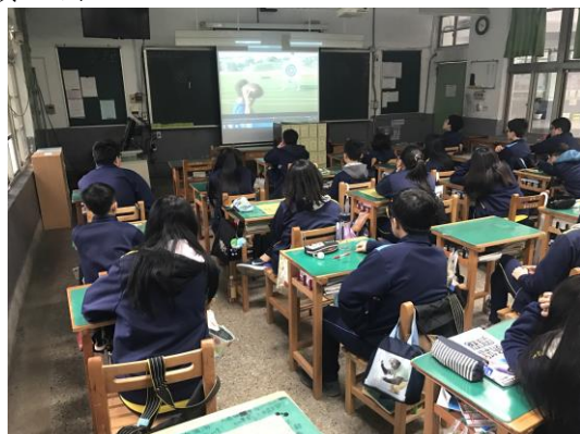
國際文化差異及價值澄清