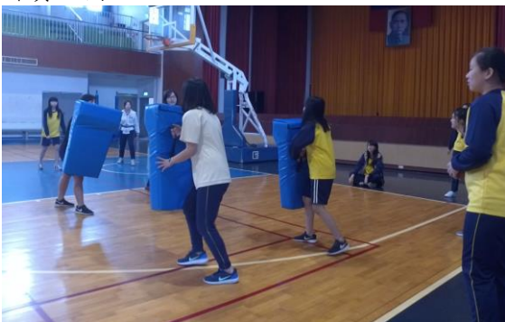
進攻方測試戰術、防守方模擬防守