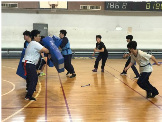
小組攻防瞬間 (男生)