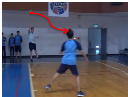
行進間傳接球搭配實作（球的路線）