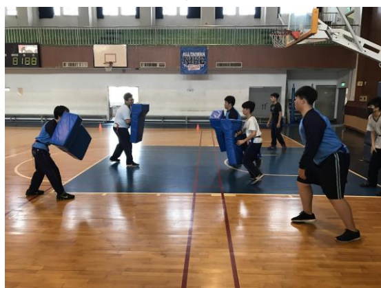
小組對抗陣列 (男生)