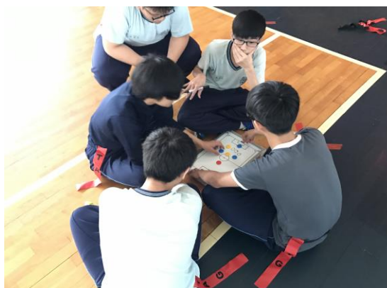
討論擬訂平面概念戰術