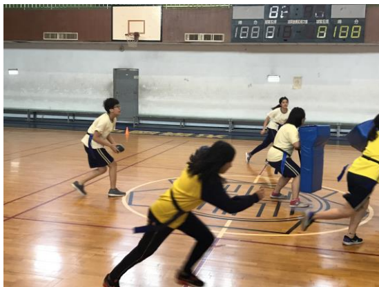
小組攻防瞬間 (女生)